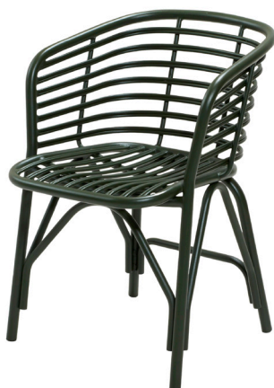
ADG Dark green