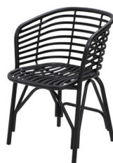
AL Lava grey