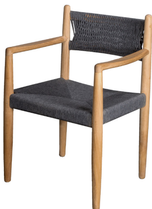
RODGT Dark grey/Teak